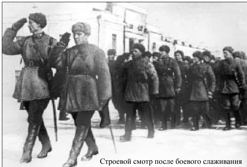
Строевой смотр после боевого слаживания на станции Алкино, 1941 год.