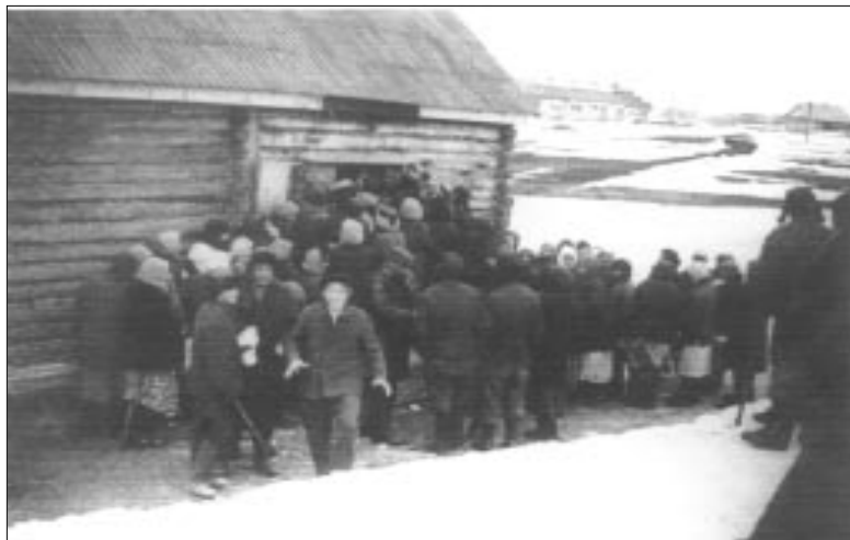
Очередь за хлебом. 1943 год.