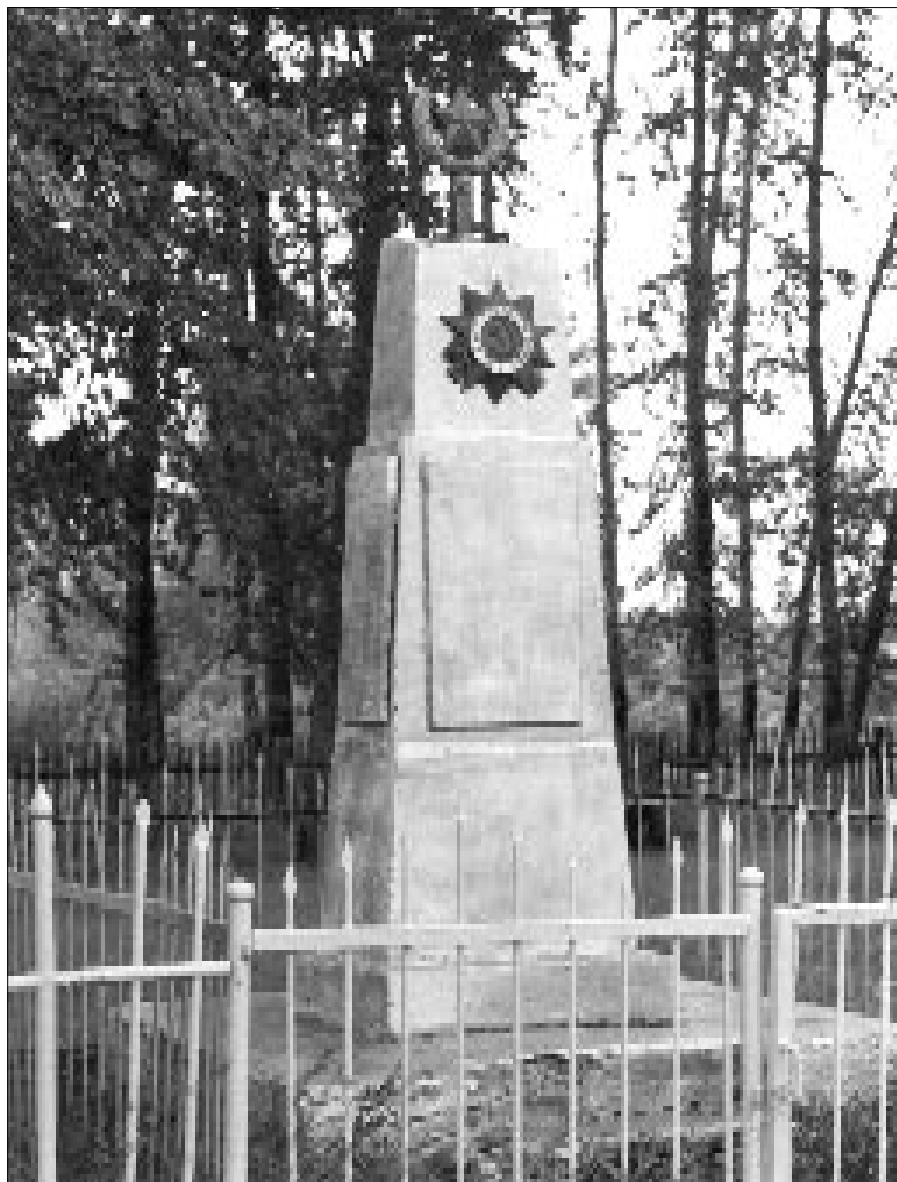
Памятник посвящен павшим или без вести пропавшим героям войны. Был установлен в 1967 году в селе Большой Аллагуват. В настоящее время находится в деревне Кантюковка Стерлитамакского района.