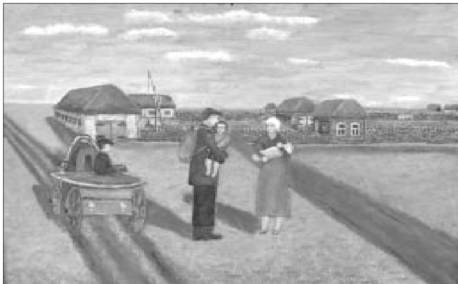
Проводы. Художник А. Ишмухаметов, уроженец д. М. Аллагуват.