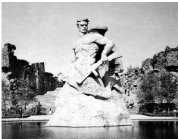
Скульптура «Стоять насмерть!» Мамаев курган.