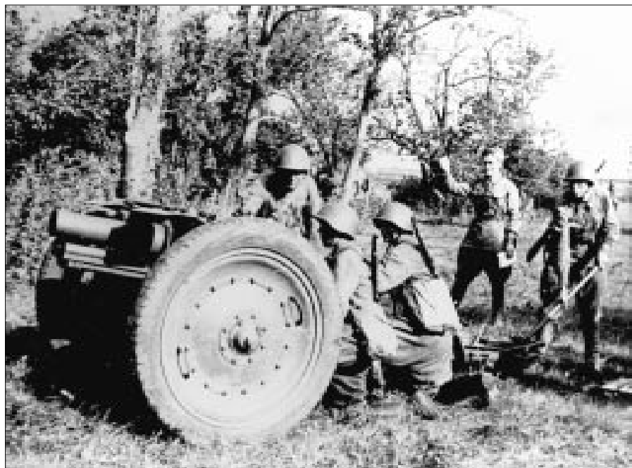
Идет боевое слаживание подразделений 214 стрелковой дивизии перед отправкой на Сталинградский фронт, п. Алкино, начало 1942 года.